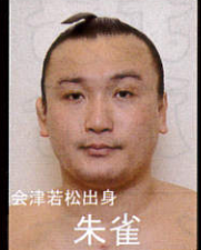
会津若松出身 朱雀