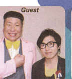
べんぎんナッツさん よしもとクリエイティブ・エージェンシー