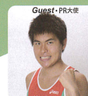
M高史さん ものまねアスリート兼人