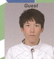
星創太選手 会津若松市出身/富士通陸上競技部