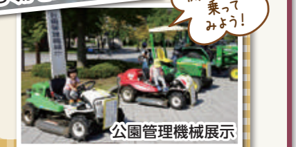
公園管理機械展示