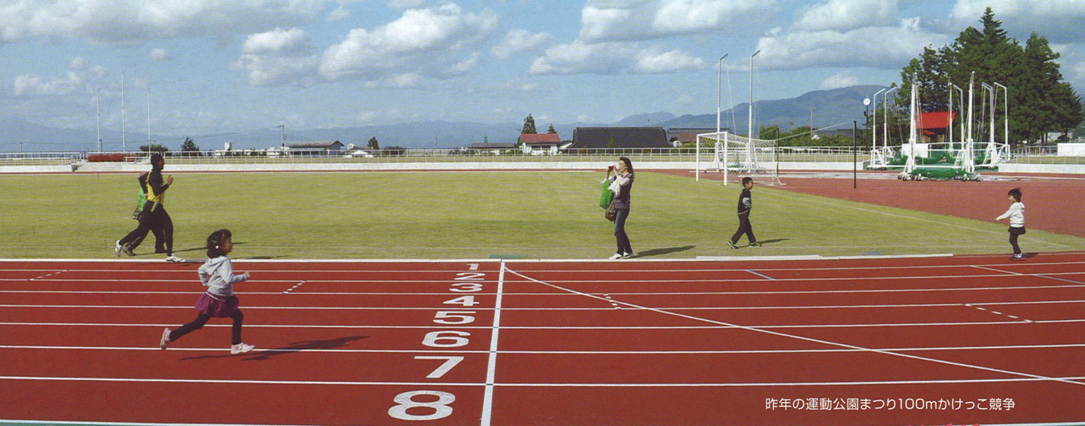
昨年の運動公園まつり100mかけっこ競争